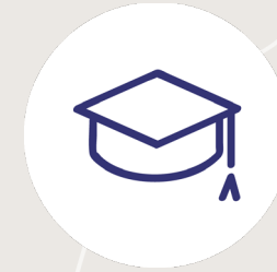
International education and training