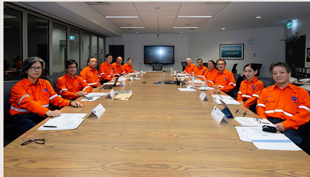
Historic INPEX Board meeting held in Darwin