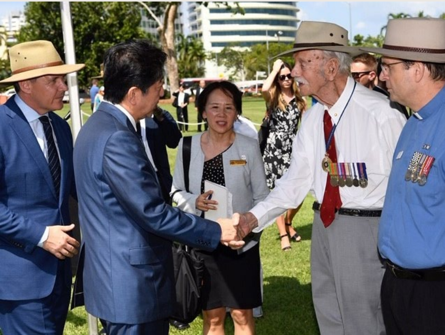
Former Prime Minister Shinzo Abe's inaugural visit to Darwin