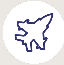
Defence and marine