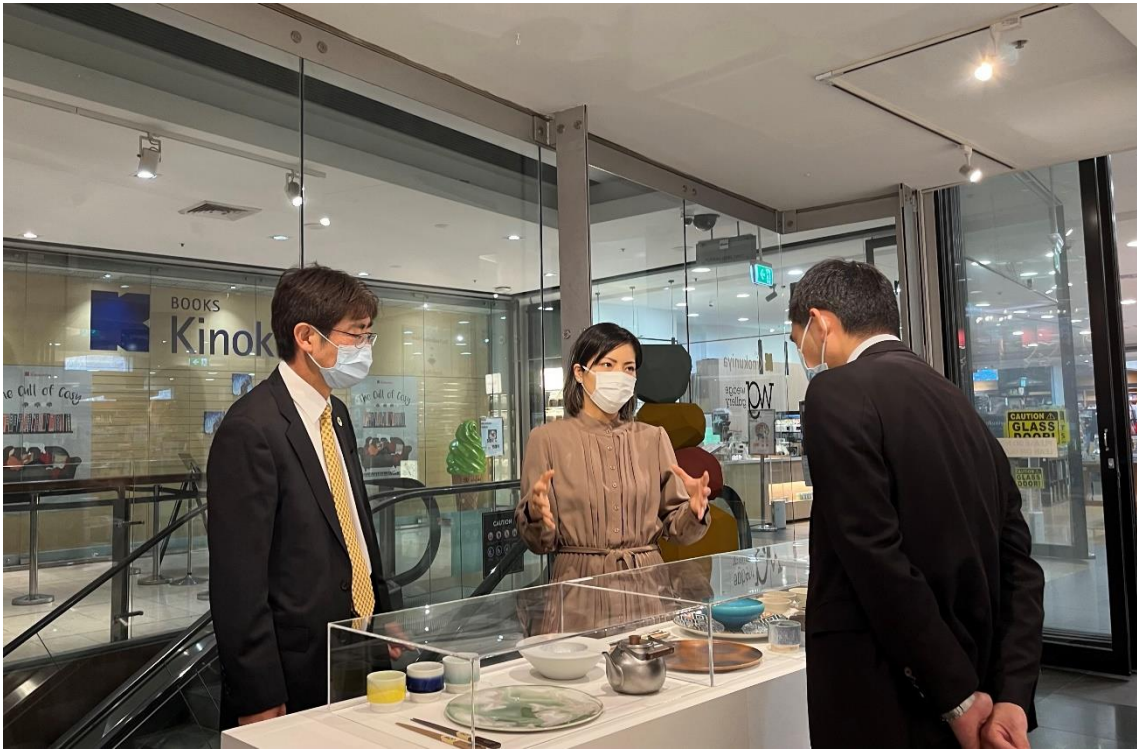
“The Handcrafted Home”展の視察（2022年8月9日）