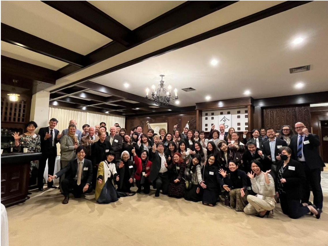
Japanaroo ネットワーキング・レセプション（2022年8月3日）