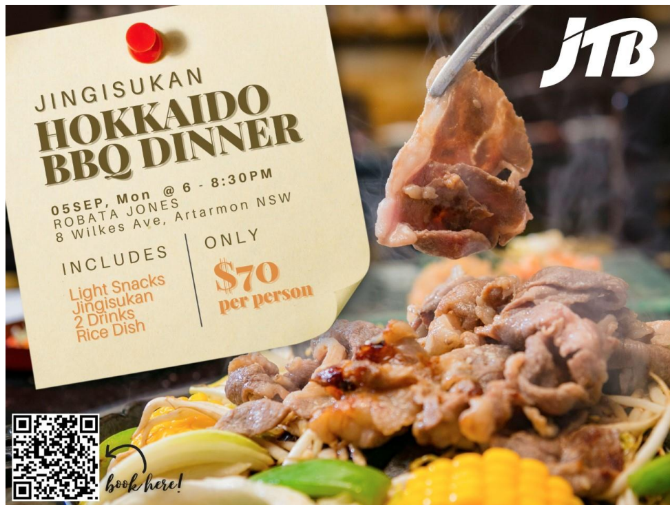
北海道 BBQ ジンギスカンナイト（2022年9月5日開催予定）