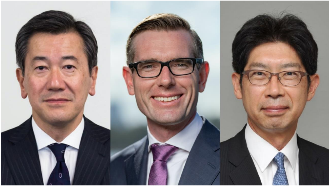
山上駐豪日本国大使、ペロターNSW州首相、私の メッセージ