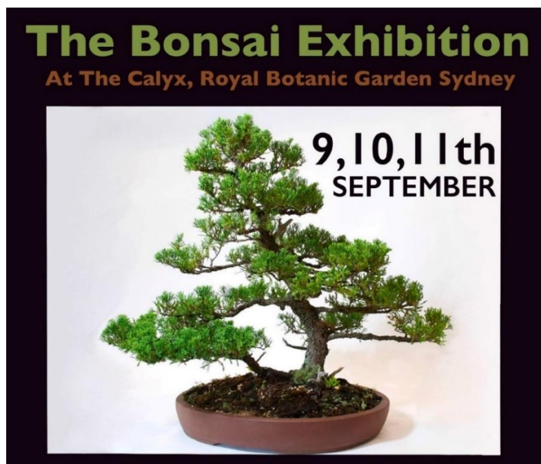
王立シドニー植物園盆栽展（2022年9月9日～11日開催予定）