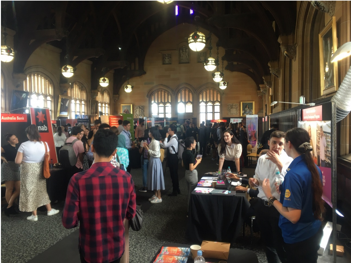
シドニー大学の就職フェアへのJETブース出展 (2020年3月4日)

オーストラリアからのJET派遣は既に33年の歴史があります。本年はコロナの関係で若干の変更はありましたが、JET参加者の募集や派遣に関する活動のサイクルは定着しています。