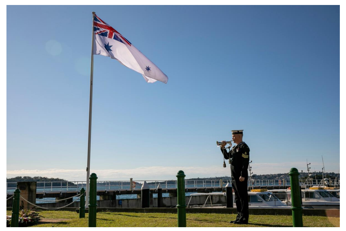
クッタバル号沈没追悼式典での軍葬ラッパ(Last Post)(2020 年 6 月 1 日,豪海軍)

追悼詩 (Ode), 軍葬ラッパ (Last Post), 黙祷など一連の行事の最後に, 豪日米 ニュージーランド4カ国の国歌が演奏され, 式典が終了しました。